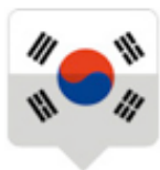
Cours de coréen