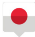
Cours de japonais