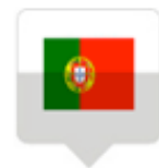
Cours de portugais

S'appuyant sur le savoir-faire reconnu d'Inflexyon et ses installations modernes, notre département des Langues Etrangères Lyon-Langues combine un enseignement de qualité et échanges interculturels pour offrir à ses étudiants une expérience linguistique riche et inédite.